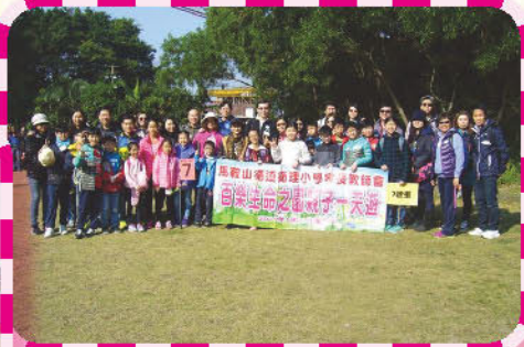
親子大旅行 - 『百樂生命之園』