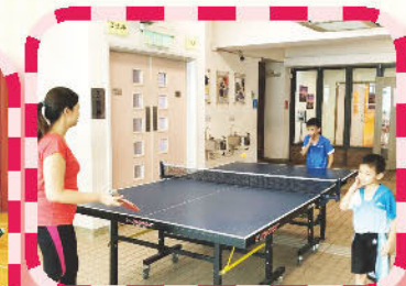
『親子鬆一鬆』- 羽毛球及乒乓球