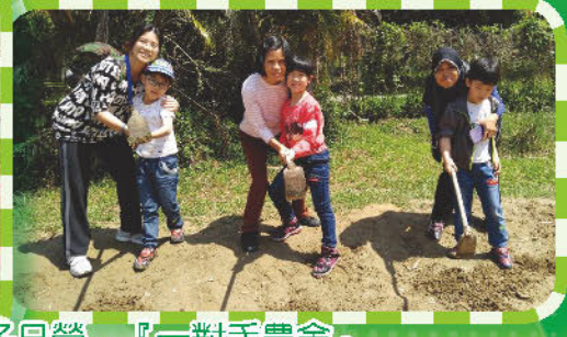
親子日營 - 『一對手農舍』