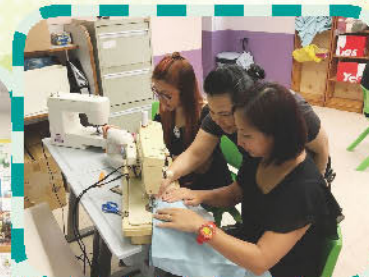
家長義工預備敬師禮物