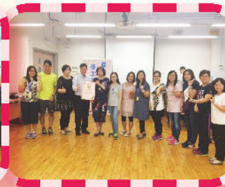
義工年度茶聚及『防蚊止癢膏手作坊』