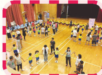
親子工作坊 - 親子樂續FUN