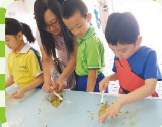
『小漂書、故事劇場、親子工作坊』