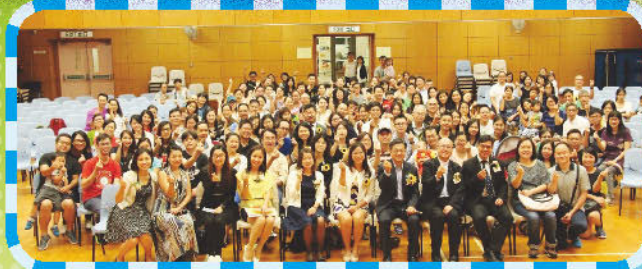
第十七屆執行委員會就職典禮及家長講座