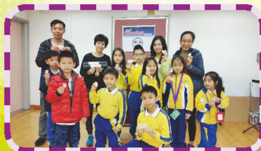
『親子鬆一鬆』- 羽毛球及魔力橋微型賽