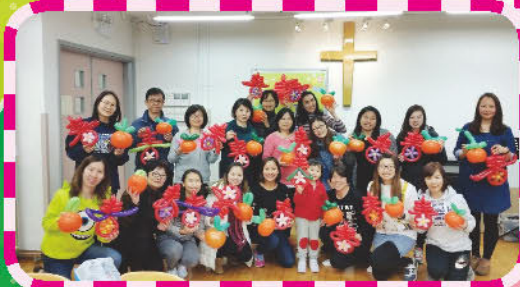
家長興趣班 - 賀年裝飾製作