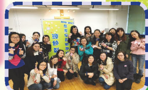
家長興趣班 - 環保髮夾(舊校服)