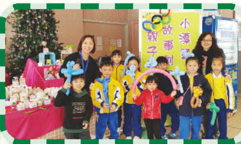
『小漂書、故事劇場、親子手作坊』