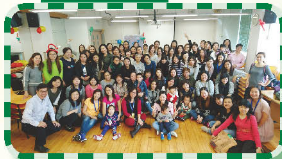
家長義工聖誕聯歡會及工作坊(冷靜瓶及星空瓶)