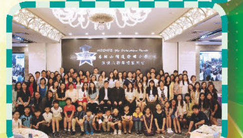
『馬循六載恩情銘於心』謝師宴